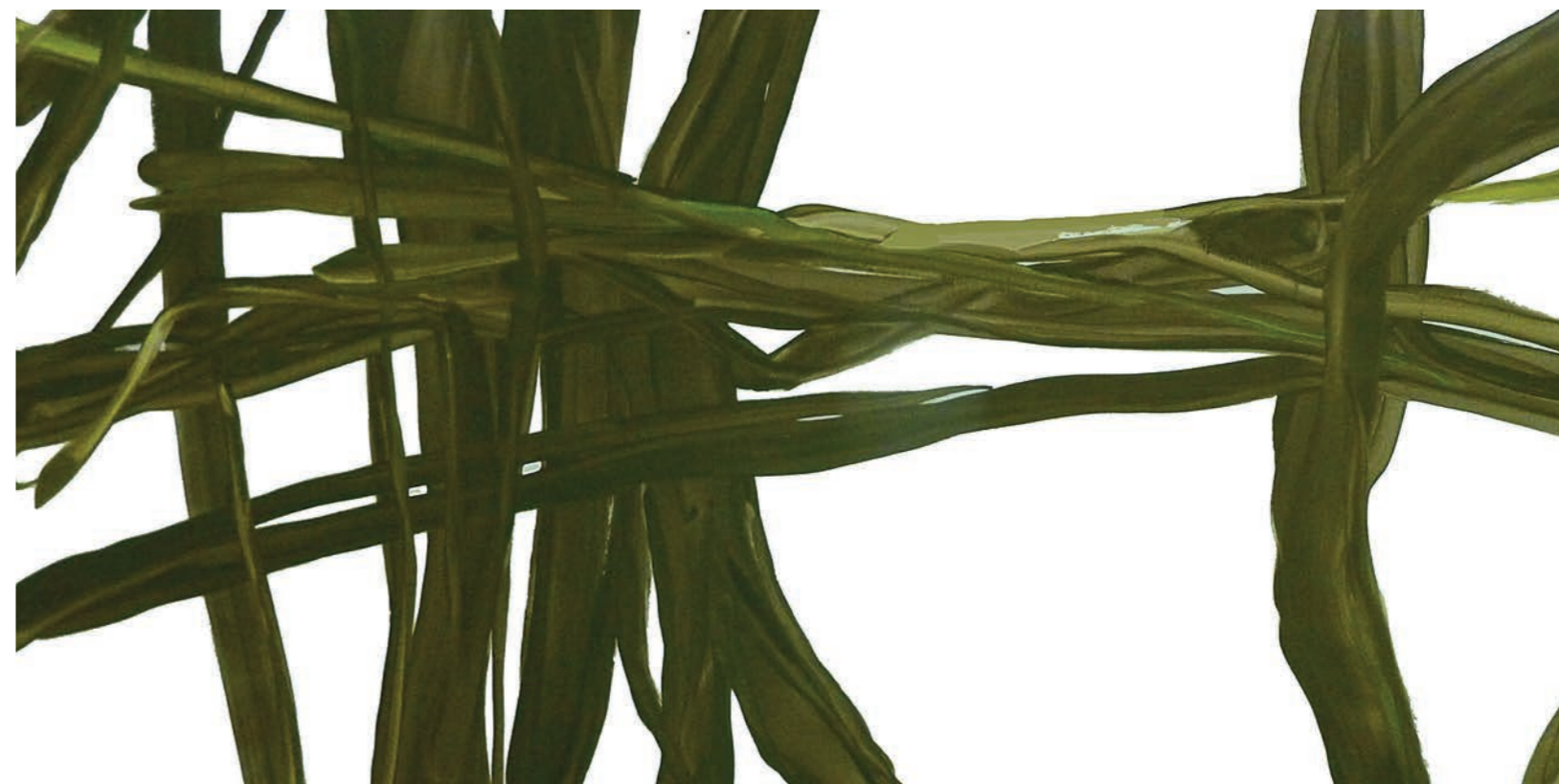
Arborescences IV 2014 - acrylique sur toile - 195X97 cm

Mais dans ces œuvres actuelles figure beaucoup plus que cela. Bénédicte Azan a mis dans ces peintures toutes ses années de pratique picturale : elle ne peut manier l'acrylique de cette façon, une façon très fluide, très « jetée », qu'en raison de sa maîtrise de l'aquarelle qu'elle a longtemps pratiquée; elle ne peut concentrer son geste sur ces quelques traits qu'après avoir longtemps réalisé des œuvres graphiques où les traits, déjà présents, émergeaient d'un ensemble comportant beaucoup plus de détails; elle n'est passée au monochrome qu'après avoir travaillé des œuvres, figuratives ou non, dans des gammes colorées qui lui ont permis aujourd'hui de saisir la valeur qu'elle accorde à chaque teinte.