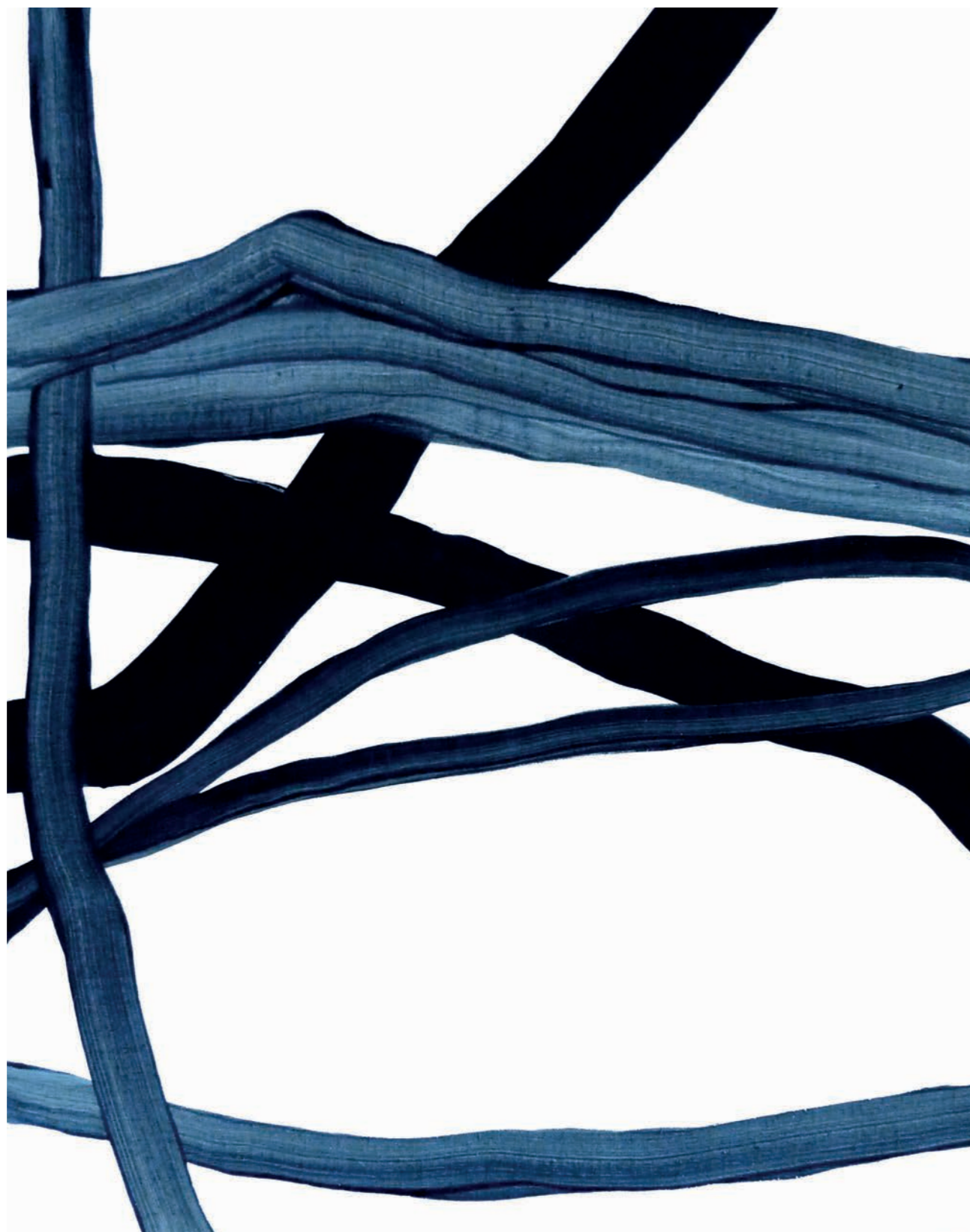
Métamorphoses I 2015 - acrylique sur toile - 100X80 cm