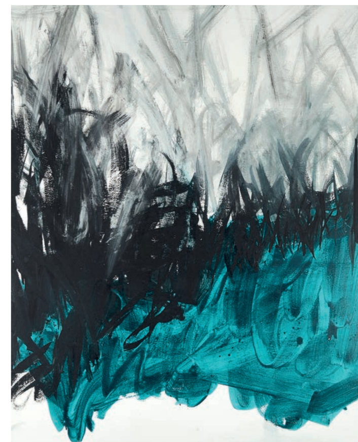
Sans titre 2013 - acrylique sur toile - 162X130 cm

Extrait d'un livret, Bénédicte Hazan, entretiens avec Pierre Manuel, Ed. Le clos du puits, Mudaison. www.vbenedicteazan.com ■