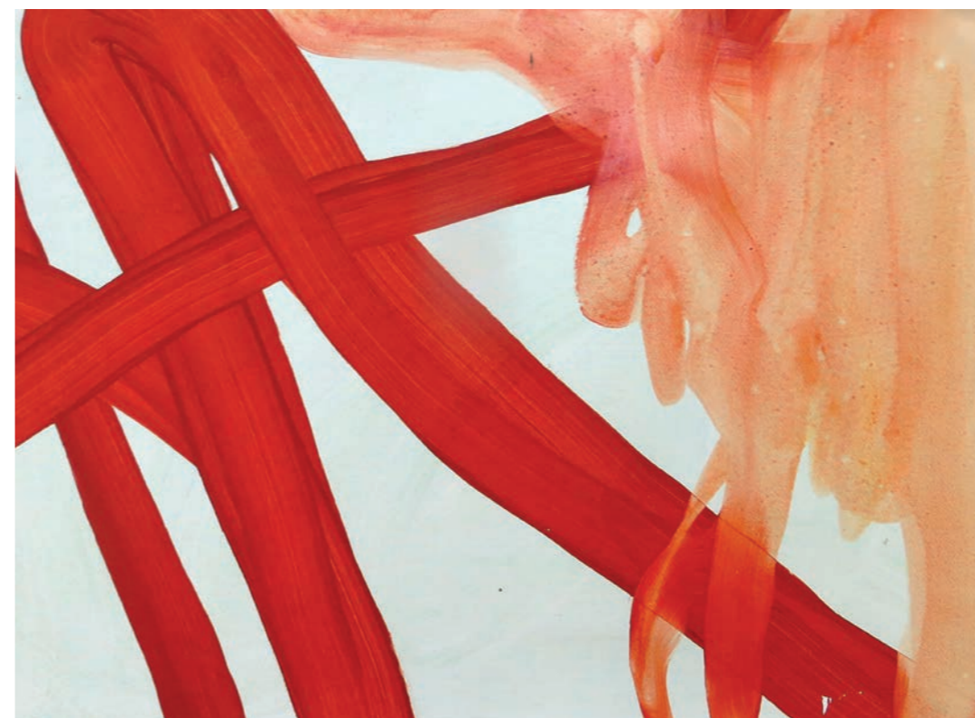
Sans titre 2015 - acrylique sur papier - 56X78 cm

Bref, le travail actuel est le résultat d'un long cheminement, qui se poursuit et va certainement mener l'artiste encore vers d'autres horizons. « Mon travail a toujours une base très figurative, explique l'artiste, dans son atelier de Madaison, à l'Est de Montpellier. J'habite un endroit magnifique et je me promène beaucoup, autour de l'étang de l'Or. Je prends des photos, qui ne sont pour moi qu'un outil pour recréer un paysage dans une autre dimension. Et puis je fais des croquis, au fusain, à l'encre, sur des grandes feuilles, sur des petits carnets. J'accumule, pour parvenir à aller à l'essentiel. Je suis comme un musicien qui a fait consciencieusement ses gammes et qui peut alors jouer de manière libérée. Aujourd'hui, mon cheminement et mon travail me renvoient un peu à l'univers de la peinture chinoise : je me retrouve dans les notions de vide et de plein, dans la recherche du souffle, qui fait que la démarche artistique est aussi une démarche spirituelle. Le choix du monochrome va dans ce sens : aujourd'hui, j'ai la volonté de dire, d'affirmer. Mon travail est le résultat d'une évolution dans laquelle la couleur est un moyen d'affirmer par son économie de choix l'importance du trait et la nécessité de le déborder. »