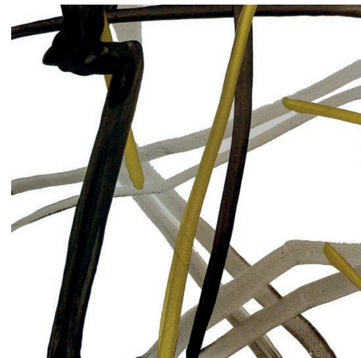
Sans Titre 2015 - acrylique sur toile - 120X120 cm

L'artiste, qui a beaucoup voyagé, habite dans la région (Mudaison, en petite Camargue) depuis 2007. Elle a ouvert au printemps 2015 une galerie dans le Haut-Var, à Tourtour, la galerie B2A.